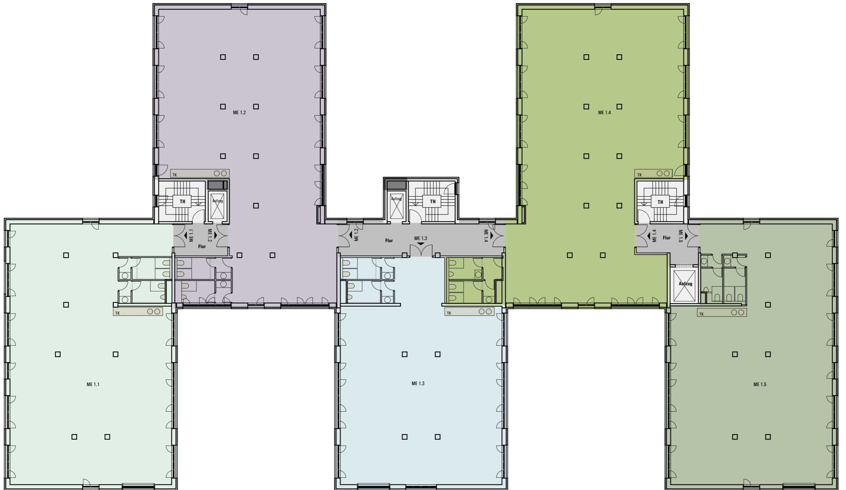
Belegungsplanung 1. Obergeschoss M 1:200 Stand: 01.12.2008