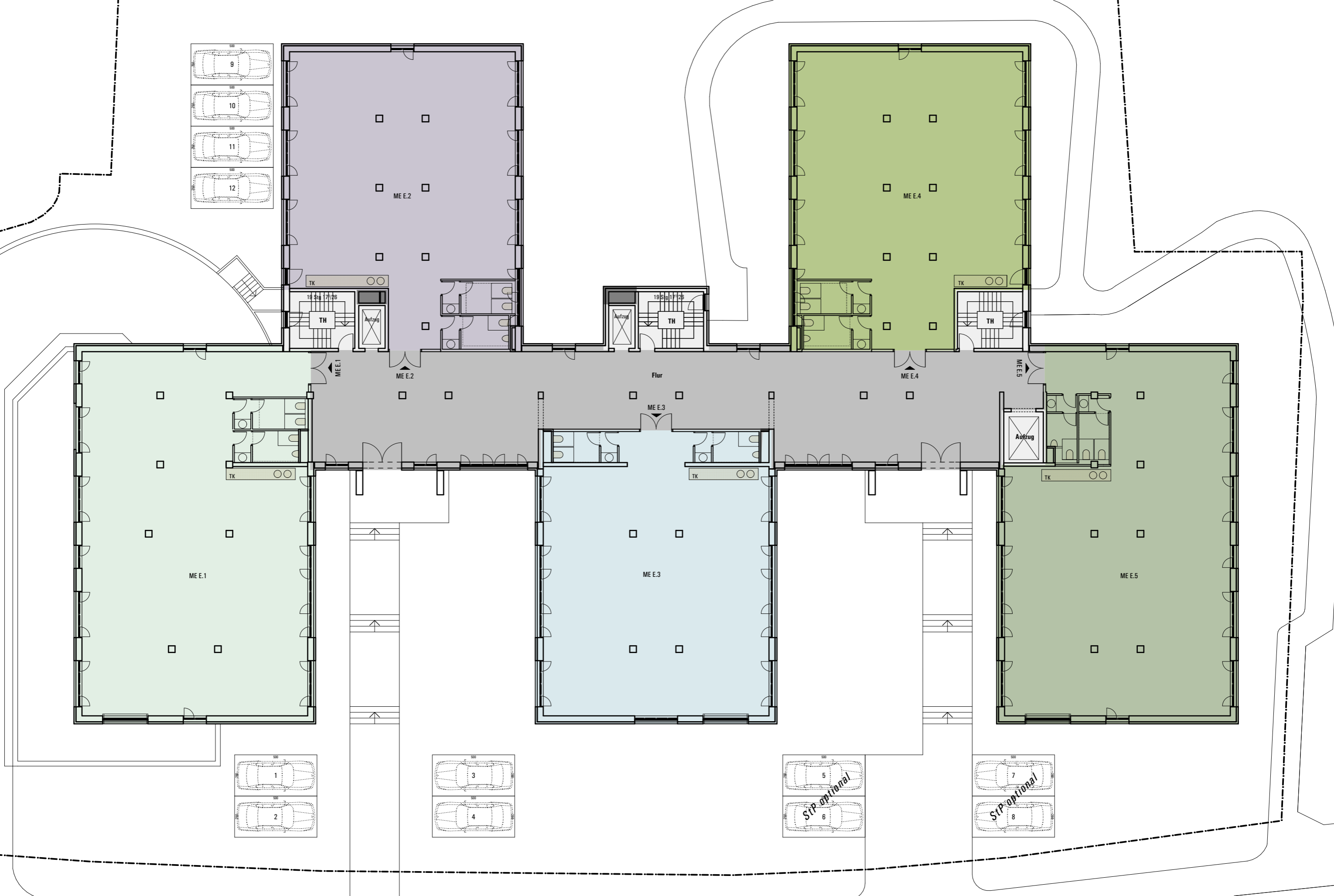
Belegungsplanung Erdgeschoss M 1:200 Stand: 01.12.2008