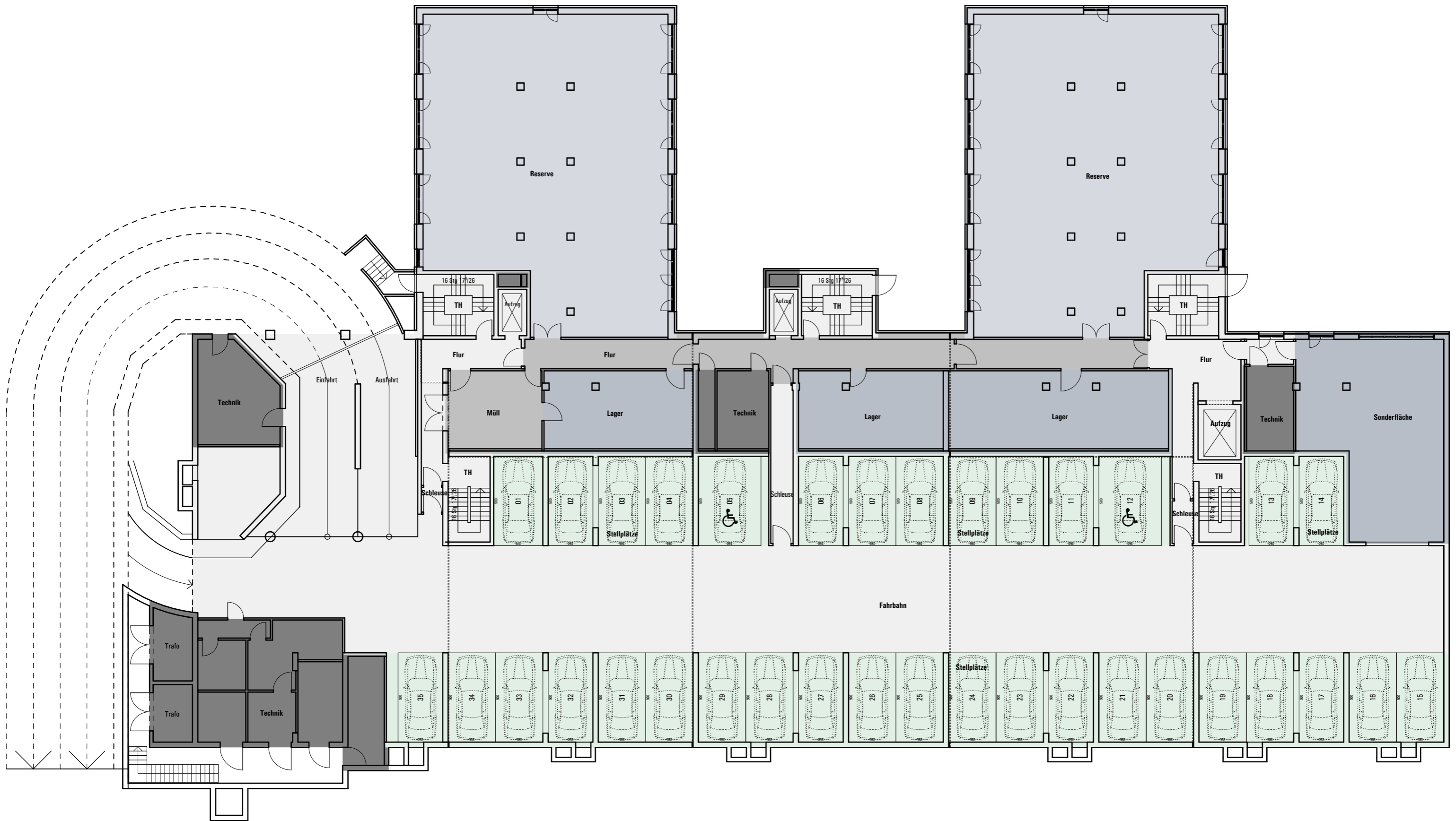
Belegungsplanung 2. Untergeschoss M 1:200 Stand: 01.12.2008